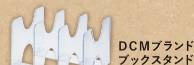
DCMブランドブックスタンド