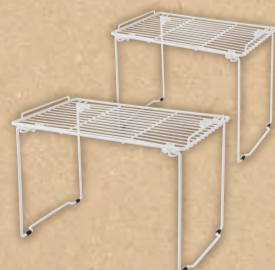
DCMブランド積み重ねができる丈夫なキッチン収納棚